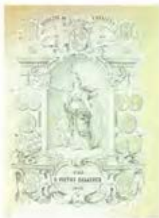
Gravat, Bellezas de la Historia de Cataluña, V. Balaguer, Imprenta N. Ramírez, Barcelona 1853

I com Balaguer diu en el pròleg al primer dels cinc volums de la seva història, que dedica "A mi patria", sense determinar-la, "nunca había existido en Cataluña un anhelo tan vivo por conocer su historia, ni en la juventud un deseo más ardiente por saber el pasado de este heroico