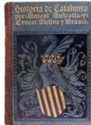
Historia de Catalunya, A. Aulèstia i Pijoan, anotada i continuada per E. Molins i Brasés, ed. Centre Artístich de M. Seguí, Barcelona, 1922

I és per això, perquè cada temps vol la seva història i els seus historiadors, que aquesta editorial en llança una de nova al mercat, perquè sigui assoliment i revulsiu, crítica i polèmica.