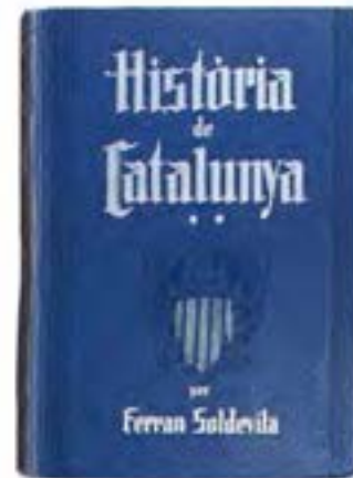
Història de Catalunya , F. Soldevila, ed. Alpha, Barcelona 1934-35

En síntesi, considero el nostre passat comú historiogràfic com la suma de tres grans corrents que successivament han aportat un cabal d'homes i obres: el Romanticisme, amb el seu afany de recuperació d'un passat gloriós, el Noucentisme, capficat en la institucionalització de la cultura i en la promoció del civisme, i el frontpopulisme de postguerra, fonamentat en la represa de Catalunya i en la codificació d'uns valors i uns símbols comuns, centrats en els elements democràtics, nacionals i socials de la nostra història. S'hi afegeix ara un nou estil crític i revisionista de fer erudició parcial, que serà positiu si busca noblement un coneixement històric millor, però que pot ser pertorbador si es converteix en instrument cec, venal o rancunios de defensa del poder espanyol. La psicologia, individual o social, ens hauria d'ajudar a entendre, per desactivar-lo, el fenomen de com en els pobles dominats i vençuts, alguns individus o figu-