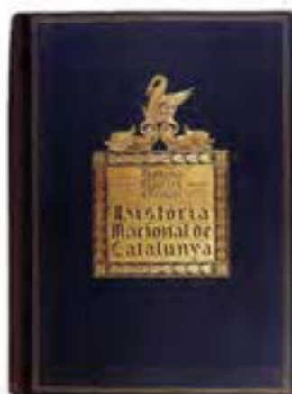
Història Nacional de Catalunya. A. Rovira i Virgili, ed. Pàtria, Barcelona 1922-34

tats del present. Avui una nova fase d'aquesta evolució se manifesta amb lo treball monogràfic, avivador de les energies locals, i amb la tendència a tractar la història des del punt de vista polític-social, fent-la entrar com a element d'estudi per a resoldre lo gran problema del regionalisme".